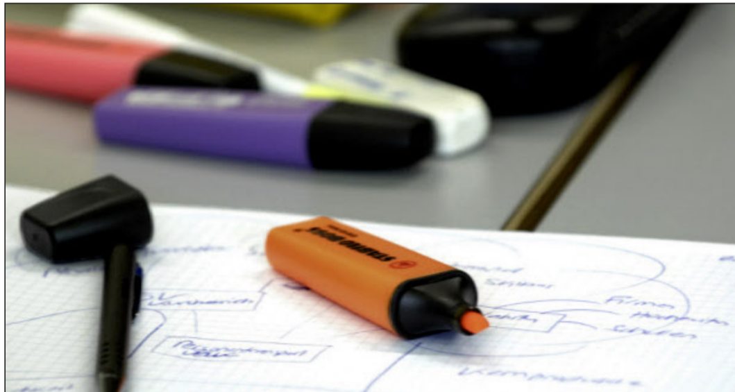
Wie lange noch können sich Touristiker auf die Fachprüfung eidg. dipl. Tourismusexperte vorbereiten?

2009 elf Diplomier-te, dieses Jahr sechs Anmeldungen: Die Lust am Tourex ist gering. Der diesjährige Kurs entscheidet über die Zukunft der Weiterbildung.