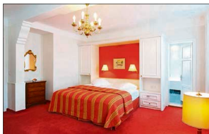
Jedes Zimmer ist anders, von historisch aus dem Jahre 1908 bis modern. Passend: kreative, regionale Küche.

Dass die Gäste im «Waldhaus» immer wieder finden, wonach sie verlangen, zeigt der grosse Anteil wiederkehrender Gäste von über 70 Prozent. Ferien hier schweissen zusammen, auch die junge Community. So bereiten sich beispielsweise alljährlich Maturanden während ihrer «Waldhaus»-Familienferien gemeinsam in der historischen Bibliothek auf die Prüfung vor. Denn wer im «Waldhaus» bucht, bleibt gleich ein paar Tage: Im Sommer beträgt die durchschnittliche Aufenthaltsdauer vier, im Winter fünf Nächte.